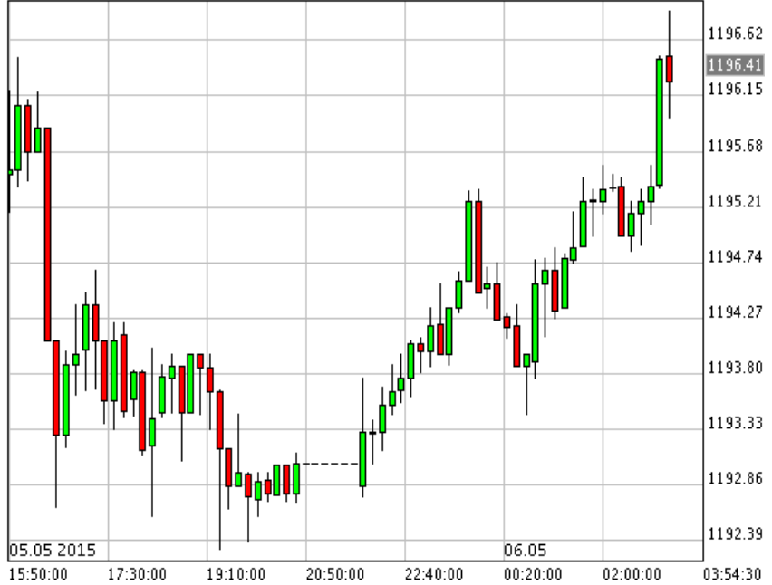
*XAU/USD_Bid 10 min