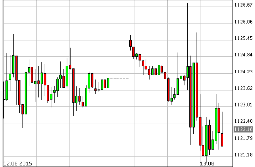
*XAU/USD_Bid 10 min

*SPDR ชื้อทอง 4.18 ตัน รวมถือครอง 671.87 ตัน