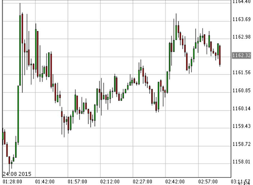
*XAU/USD_Bid 1 min

*SPDR ซื้อทอง 2.39 ตัน รวมถือครอง 677.83 ตัน